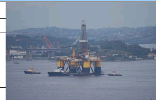
Ursus vor Rio