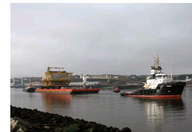
Centaurus mit Barge