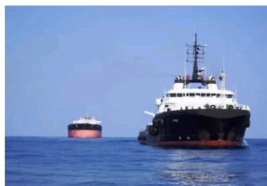
Janus mit MV Afrika