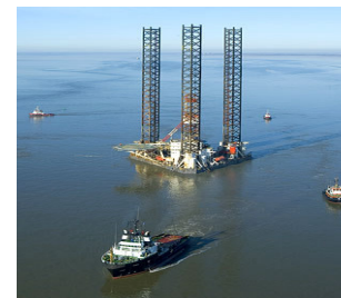
Taurus mit Rig