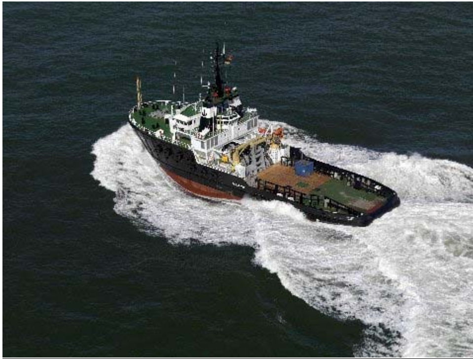
(AHT "URSUS" im Einsatz)