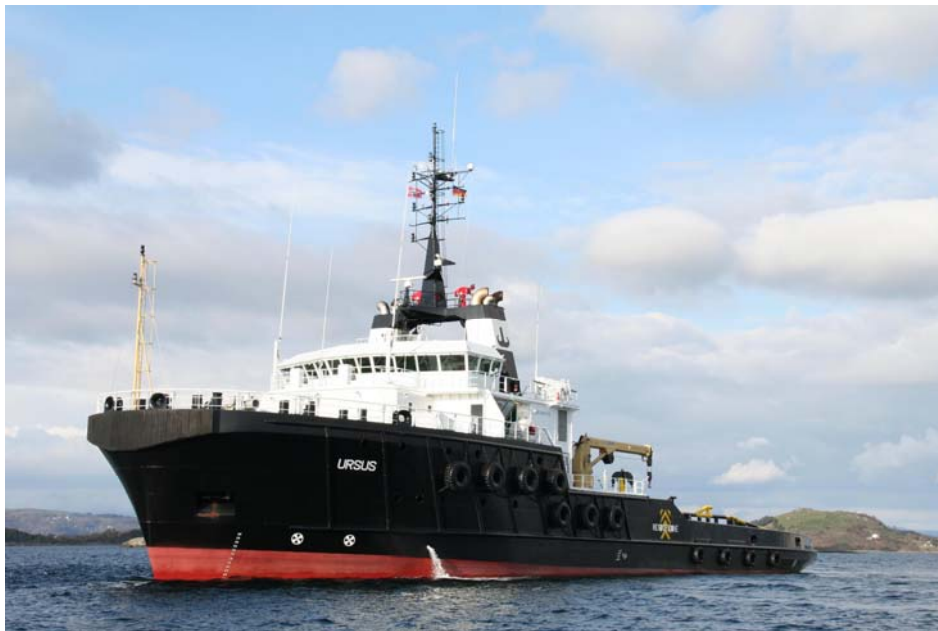
(AHT "URSUS" vor einem Einsatz)