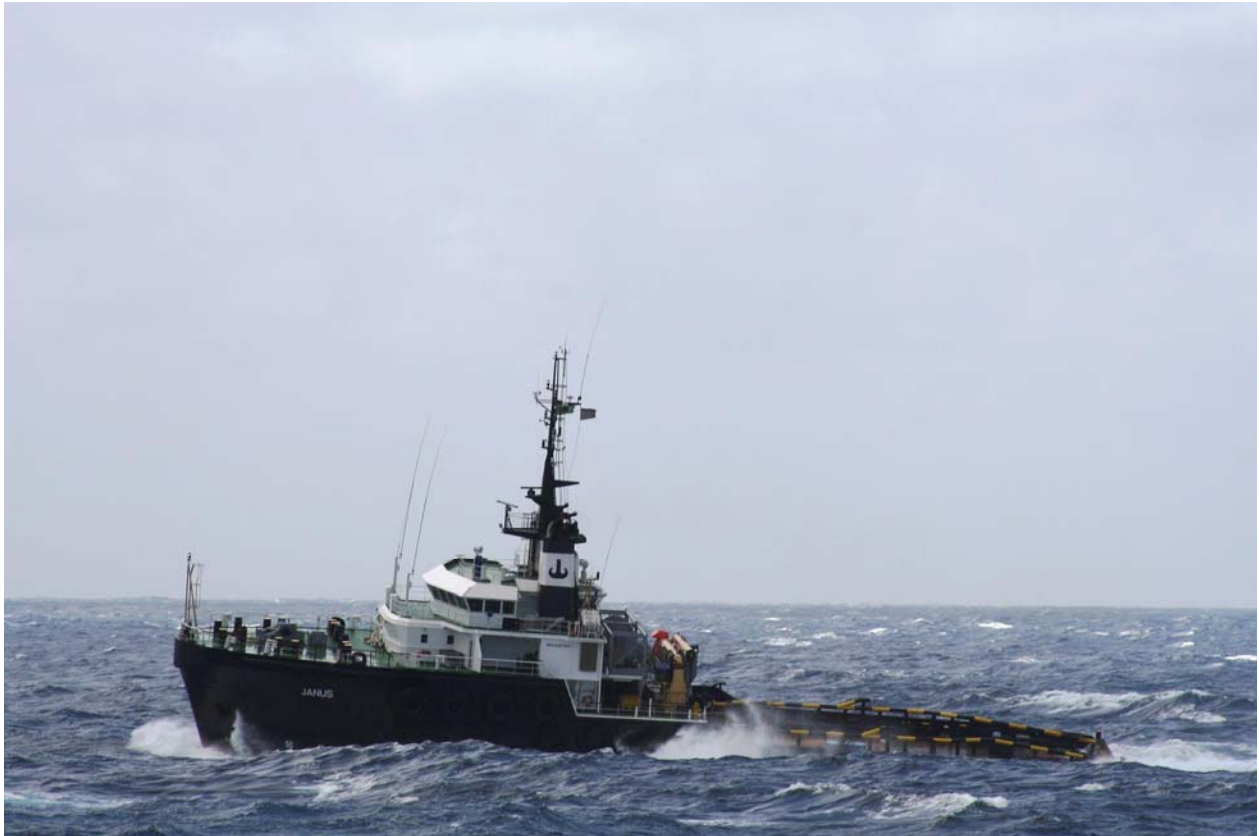
(AHT "JANUS" bei starkem Seegang)