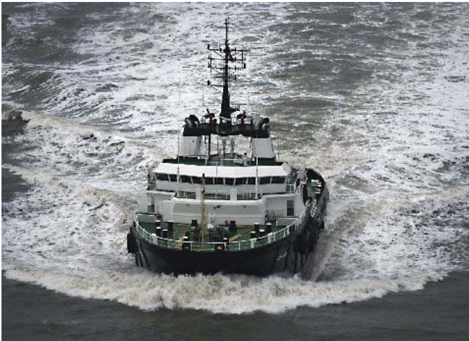
(AHT "JANUS" auf dem Weg zum nächsten Job)

Hamburg, den 3. September 2009 Klaus Dieter Mayer